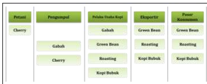
Gambar 2 Rantai Pasok Komoditas Kopi