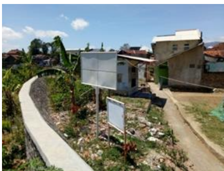
Gambar 1: Sempadan kampung Rengganis

sungai yang ada dikawasan tersebut perlu direvitalisasi Beberapa potensi permasalahan di kawasan bantaran Sungai Simanuk antara lain pemanfaatan ruang yang tidak memadai dan penuh, yang ditandai dengan adanya bangunan yang kembali ke tepi sungai, aksesibilitas yang masih rendah, pejalan kaki yang masih belum jelas, dan tersedia ruang terbuka publik. masalah. Masih kecil, RTH masih kecil, sampah belum tertangani dengan baik, informasi kurang dikelola, sarana prasarana dan penunjang belum memadai, belum ada jalur perahu untuk wisata air, dan sekitarnya yang belum ada. belum terintegrasi dengan tepian sungai dan arus gunung pada tahun 2016. Berangkat dari potensi permasalahan tersebut, maka tujuan dari penelitian ini adalah untuk mempelajari pemanfaatan lahan kosong di kawasan bantaran Sungai Simanuk, dan untuk menentukan struktur dan strategi pengembangan RTH yang dirancang sesuai dengan karakteristik Sungai Simanuk, dengan tujuan. untuk meningkatkan kualitas dan kepribadian lingkungan. Kabupaten Garut yaitu Garut Kota INTAN (Indah, Tertib, dan Nyaman).