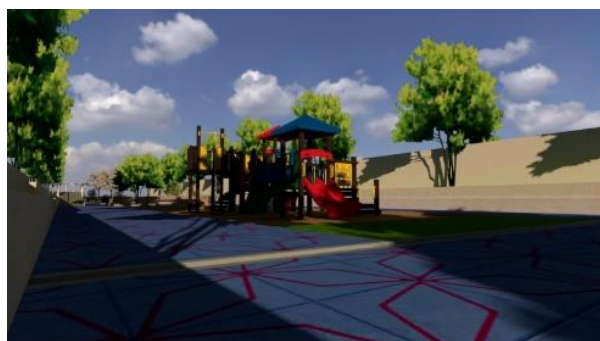
Gambar 8: Desain RTH

Beberapa referensi tersebut menurut peneliti telah memenuhi fungsi RTH seperti di peraturan Menteri Pekerjaan Umum[5]. Berdasarkan referensi tersebut peneliti mencoba mengadopsi desain Sungai Seine dan Sungai Rhone dalam merencanakan dan mendesain ruang terbuka hijau di sempadan Sungai Cimanuk. Berikut desain yang telah dirancang di tampilkan pada Gambar 8.