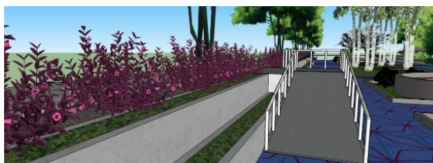
Gambar 11: Desain Akses Untuk Berkebutuhan Khusus

Karena elevasinya -1 meter maka perlu jalur khusus untuk orang berkebutuhan khusus, sehingga tetap bisa menikmati atau mengunjungi RTH dengan aman dan selamat.