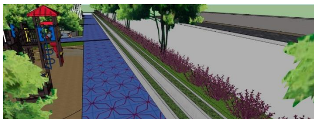
Gambar 10: Desain Flower Zone Sisi Kanan

Flower zone bertujuan sebagai area untuk budidaya bunga atau tanaman hias yang bisa di jadikan sebagai salah satu pemasukan untuk kampung Rengganis, selain itu untuk memperindah RTH. Flower zone direncanakan di sisi kanan dan kiri lajur.