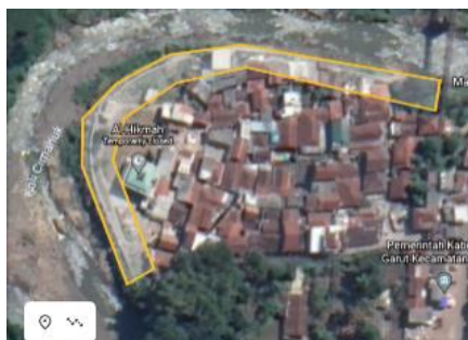
Gambar 5: Marking Area

Pada perencanaan RTH sempadan Cimanuk pula didasarkan pada Peraturan Menteri Di kampung Rengganis sudah terdapat RTH rukun warga dengan luas \pm 884 \text{ m}^2 dengan keliling 227 m yang mempunyai fasilitas untuk berbagai kegiatan, maupun aktivitas lainnya seperti untuk kegiatan olahraga terdapat lapangan mini untuk anak-anak bermain bola atau pun lainnya, pada Gambar 6 Terdapat taman bermain anak, namun jika ditinjau dari fungsinya masih belum maksimal karena fungsi estetika dan ekonomi belum terpenuhi. Sebelum mendesain ruang terbuka hijau untuk sempadan sungai cimanuk peneliti terlebih dahulu melakukan observasi ke lokasi penelitian, saat observasi pula peneliti berdiskusi dengan beberapa warga sekitar membahas kebutuhan dan penggunaan lahan sempadan sungai untuk warga sekitar tentunya untuk lingkungan sekitar pula. Warga sekitar berharap agar sempadan sungai dijadikan tempat olahraga ataupun taman.