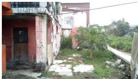
Gambar 4: Kondisi rumah warga

Kawasan Rengganis merupakan salah satu kawasan yang padat penduduk di Kab. Garut, minimnya area terbuka hijau di kawasan tersebut serta terdapat bangunan rumah warga di daerah sempadan sungai merupakan beberapa masalah yang ada di kawasan tersebut. Gambar 4 memperlihatkan kondisi rumah warga dekat area sempadan sungai yang padat di tempati oleh penduduk. Luas area yang diteliti yaitu \pm 8,4 \text{ km}^2 . Hasil observasi di area lain diperlihatkan oleh Gambar 4 kondisi lingkungan yang tidak terawat sehingga tanaman liar tumbuh dengan subur dan letak bangunan sangat dekat dengan sungai, sesuai dengan peraturan Menteri PUPR No. 28/PRT/M/2015 pasal 18 bahkan terdapat papan peringatan mengenai sempadan sungai namun kenyataannya masih ada warga yang tidak ingin direlokasi oleh pemerintah ke tempat yang seharusnya[2].