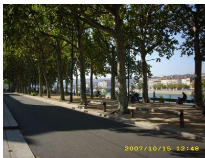
Gambar 7: Sempadan Sungai Seine

Sungai Seine terletak di Paris (Prancis), sungai tersebut salah satu wisata unggulan di negara tersebut, sempadan sungai Seine dikonsepsi sebagai penyangga kebutuhan energi dan konsumsi air bersih warga Paris selain itu sungai tersebut dijadikan untuk pembangkit listrik tenaga nuklir. Pemerintah Prancis dapat mengimplementasikan potensi sungai tersebut untuk kemakmuran warganya[4].