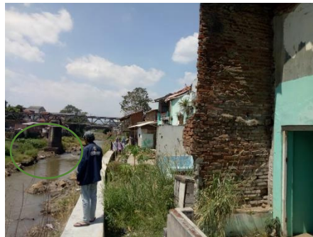
Gambar 9: Area Tak Bertanggung

Berdasarkan perhitungan dimensi tanggul untuk daerah yang tidak bertanggung dikelurahan Rengganis yaitu lebar mercu 3 meter, dan untuk tinggi jagaan 0,6 m. Tanggul tersebut menurut peneliti di perlukan karena untuk melindungi area pertanian warga yang menjadi sumber mata pencaharian dan melindungi asset warga dari bencana banjir atau longsor [7].