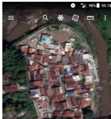
Gambar 3: Lokasi Penelitian

Lokasi yang dipilih dalam penelitian ini adalah sebagai berikut :