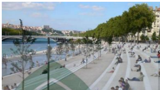
Gambar 6: Sempadan Sungai Rhone

Sungai Rhone terletak di Lyon (Prancis), sempadan sungai tersebut digunakan untuk taman selain itu dijadikan juga sebagai tempat olahraga.