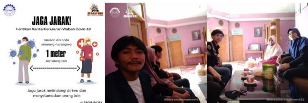
Gambar 6 Konten Dan Kunjungan UMKM

Pada tanggal 13 agustus 2020 kami dari tim KKN Desa Maripari melakukan kegiatan pembuatan konten multimedia mengenai jaga jarak secara Daring, yang kami lakukan yaitu membuat sebuah konten multimedia dalam bentuk poster online yang kami sebar melalui Instagram. Pada tanggal 14 kami melakukan kegiatan pendataan mengenai UMKM yang ada di Desa Maripari, informasi yang didapat bahwa di desa maripari terdapat 10 industri rumahan dan 10 buah perusahaan kecil. Pada hari yang sama kami langsung melakukan silaturahmi dengan pemilik usaha rumahan yang membuat asinan untuk oleh-oleh yaitu jetelek. Jetelek merupakan makanan yang terbuat dari tepung beras yang diberi kelapa untuk membuatnya menjadi renyah. Pemilik usaha biasanya membuat jetelek untuk pelanggan yang sudah pesan terlebih dahulu atau dalam kata lain make to order . Untuk proses pembuatannya masih menggunakan alat manual.