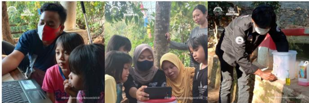
Gambar 10. Literasi Dan Pembuatan Tempat Cuci Tangan

Pada tanggal 20 Agustus 2020 kami membuat tangki pencuci tangan untuk disimpan di depan rumah ibu RW 04. Pada tanggal 21 Agustus 2020 kami melakukan beberapa kegiatan seperti memberikan edukasi kepada anak-anak menggunakan media elektronik tentang pentingnya jaga kebersihan dan cara mencuci tangan 6 langkah. Setelah itu kami membuat konten dalam bentuk video mengenai cara mencuci tangan.