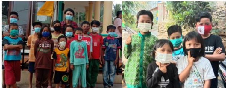
Gambar 5 Membagikan Masker

Pada tanggal 7 agustus 2020, kami memberikan masker kepada masyarakat yang tidak menggunakan masker pada saat beraktifitas diluar ruangan. Pada tanggal 8 agustus 2020, kami dari tim KKN Desa Maripari melaksanakan kegiatan akhir mingguan berupa membuat video 1 menit dan laporan mingguan untuk kegiatan di akhir minggu. Dan kegiatan ini merupakan kegiatan yang dilakukan secara rutin di setiap akhir pekan. Dan sebagai tambahan kami juga membuat video mengenai profil Desa Maripari yang muat dalam IG TV.