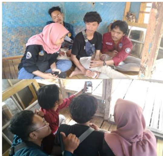
Gambar 12 Bimbingan Dan Perencanaan