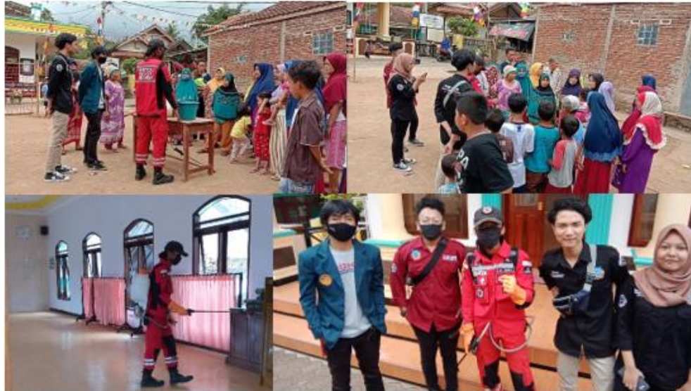
Gambar 9. Sosialisasi Dan Penyemprotan Cairan Disinfektan

Pada tanggal 19 Agustus melakukan sosialisasi pembuatan cairan disinfektan kepada masyarakat Desa Maripari. Sosialisasi dilaksanakan oleh tim KKN Desa Maripari dengan bantuan dari volunteer merah putih vertical rescue kabupaten Garut. Dan setelahnya dilakukan penyemprotan di lingkungan masyarakat RW 04 Desa Maripari.