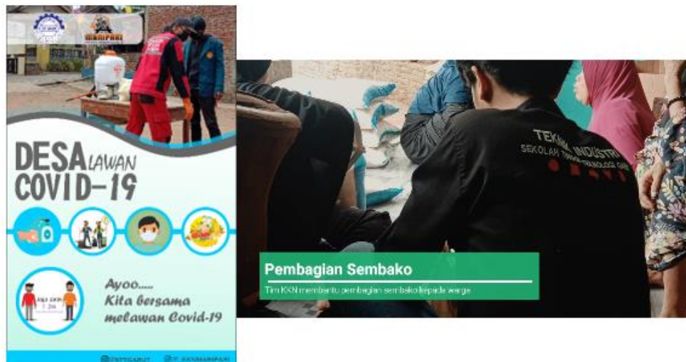
Gambar 14 Pembuatan Konten Dan Pembagian BPNT

Pada tanggal 26 agustus kami melaksanakan kegiatan rutin yaitu membuat konten multimedia mengenai desa lawan Covid-19. Dan sekaligus membantu ketua RW 04 membagikan bantuan dari pemerintah atau BPNT.