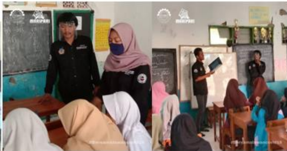
Gambar 5 Literasi Digital Minggu Ke-2

Pada tanggal 11 agustus 2020, kami melaksanakan kegiatan rutin yaitu bimbingan dan perencanaan dengan dosen pembimbing lapangan mengenai program kerja yang telah dilaksanakan dan meminta bimbingan untuk program kerja yang akan dilaksanakan kedepannya. Pada tanggal 12 agustus 2020 kami melaksanakan kegiatan lapangan yang melibatkan siswa siswi Madrasah Tsanawiyah Maripari mengenai edukasi teknologi informasi dan pencegahan Covid-19. Dimana kita melakukan pemberian materi mengenai pengenalan teknologi informasi Microsoft Office salah satunya Microsoft word . Dan untuk pencegahan covid-19 kami memberikan sedikit informasi mengenai pentingnya jaga jarak.