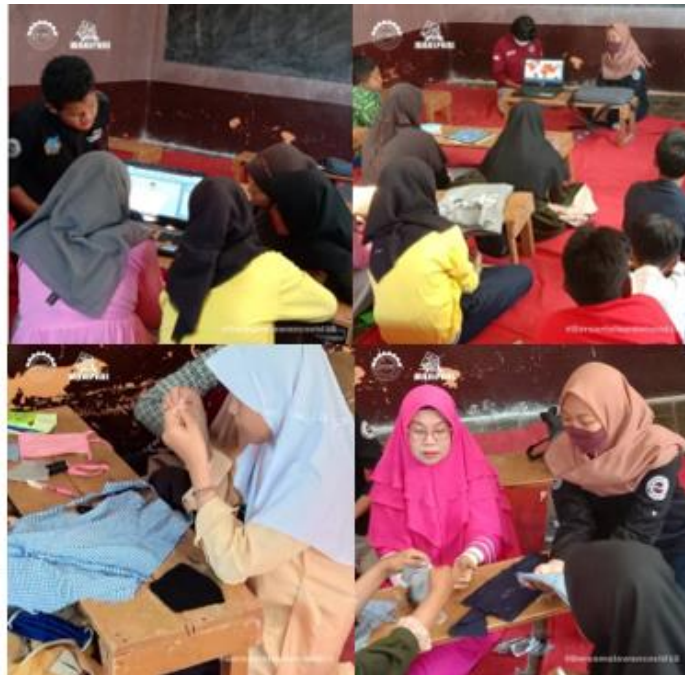
Gambar 13 Literasi Covid Dan Pembuatan Makser Kain

melaksanakan peningkatan kapasitas yaitu mempraktikkan cara membuat masker kain yang dibantu oleh guru prakarya di MTS tersebut.