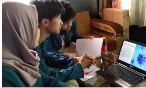
Gambar 3 Literasi Minggu 1

Pada tanggal 5 agustus 2020, kami dari tim KKN Desa Maripari melakukan silaturahmi dengan kepala Desa sekaligus pendataan mengenai fasilitas-fasilitas yang ada di Desa Maripari. Diantaranya Desa Maripari memiliki sarana pendidikan yang tinggi dari Madrasah Diniyah Takhmilyah yang terhitung ada 18 buah. Pada tanggal 5 Agustus 2020, kami dari tim KKN Desa Maripari melakukan kegiatan pembuatan konten multimedia mengenai pengetahuan dasar covid-19 secara Daring, yang kami lakukan yaitu membuat sebuah konten multimedia dalam bentuk poster online yang kami sebar melalui Instagram.