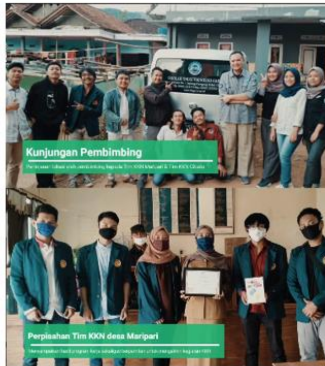
Gambar 15 Kunjungan DPL dan Perpisahan KKN

dilaksanakan, maka selanjutnya mahasiswa menyusun artikel kegiatan untuk laporan akhir KKN Tematik STT-Garut. Laporan akhir ini bertujuan sebagai bahan evaluasi untuk mahasiswa dan DPL juga masyarakat Desa Maripari.