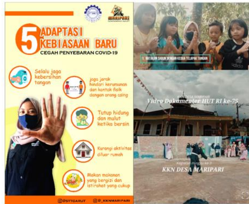
Gambar 11. Poster dan Video Dokumentasi Minggu Ke 3