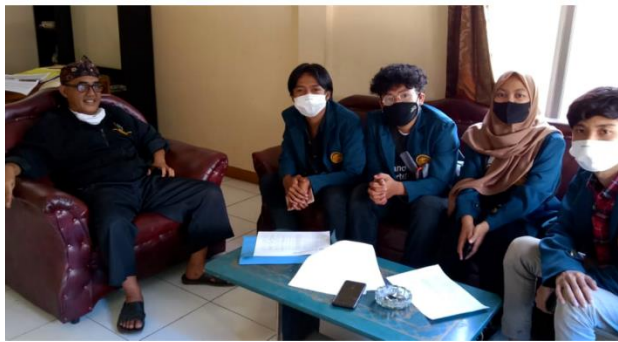
Gambar 4 Pendataan Dan Pembuatan Konten Minggu 1

Pada tanggal 5 agustus 2020, kami dari tim KKN Desa Maripari melakukan silaturahmi dengan kepala Desa sekaligus pendataan mengenai fasilitas-fasilitas yang ada di Desa Maripari. Diantaranya Desa Maripari memiliki sarana pendidikan yang tinggi dari Madrasah Diniyah Takhmilyah yang terhitung ada 18 buah. Pada tanggal 5 Agustus 2020, kami dari tim KKN Desa Maripari melakukan kegiatan pembuatan konten multimedia mengenai pengetahuan dasar covid-19 secara Daring, yang kami lakukan yaitu membuat sebuah konten multimedia dalam bentuk poster online yang kami sebar melalui Instagram.