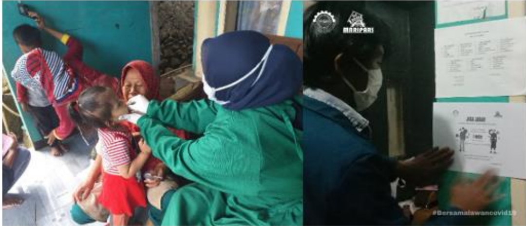
Gambar 7. Posyandu Dan Penempelan Masker

Pada tanggal 15 Agustus 2020 kami melakukan dua kegiatan sekaligus yaitu membantu satuan tugas penanggulangan Covid-19 Desa Maripari melakukan kegiatan Posyandu untuk memberikan Vitamin-A kepada balita dan batita. Dan juga melakukan penempelan poster jaga jarak dilingkungan sekitar RW 04. Pada tanggal 16 Agustus 2020, kami dari tim KKN Desa Maripari melaksanakan kegiatan akhir mingguan berupa membuat video 1 menit dan laporan mingguan untuk kegiatan di akhir minggu.