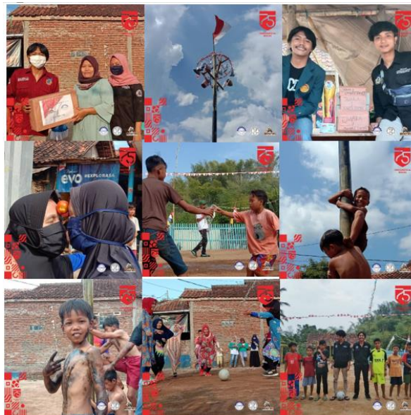
Gambar 8. Panitia HUT RI

Pada tanggal 17 Agustus kami bersama ikatan remaja pasantren Desa Maripari melakukan perlombaan untuk memperingati Hari Ulang Tahun Republik Indonesia ke 75. Kegiatan perlombaan yaitu futsal anak, lomba makan kerupuk, lomba estafet air, lomba makan biskuit, lomba memasukan paku kedalam botol, lomba memecahkan air, dan lomba koin dalam papaya untuk anak-anak. Sedangkan lomba untuk ibu-ibu terdiri dari lomba futsal, lomba tangkap hadiah, dan lomba memasukan benang kedalam jarum. Pada tanggal 18 Agustus masih dalam rangka HUT RI ke 75, kegiatan perlombaan masih dilakukan yaitu lomba panjat pinang, dan setelahnya kami memberikan apresiasi kepada para pemenang dengan memberikan mereka hadiah.