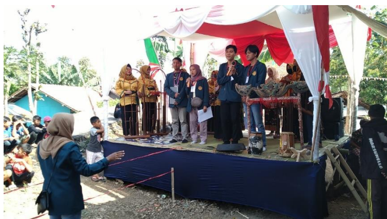
Gambar 6. Pembukaan Kegiatan Perayaan Kemerdekaan Indonesia

Gambar di atas merupakan kegiatan pengecatan dan dekorasi pos ronda yang dibantu masyarakat sekitar.