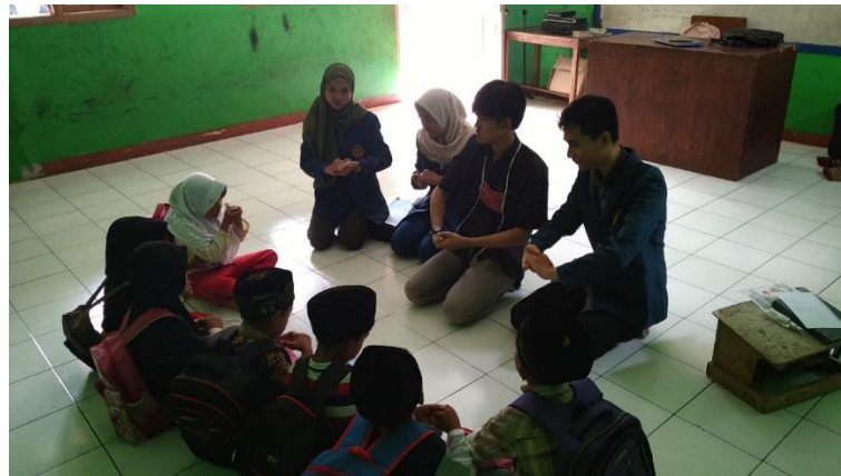
Gambar 3. Pemberian Materi Kepada Pelajar Sekolah Dasar

Aplikasi PIC-19 sudah dipublikasikan sehingga dapat diunduh oleh masyarakat luas. Manfaat dari aplikasi PIC-19 ini masyarakat menjadi lebih mudah dalam mencari informasi tentang COVID-19 serta dapat melakukan check-up mandiri untuk mengetahui kemungkinan tertular COVID-19.