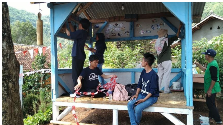
Gambar 5. Proses pengecatan dan Dekorasi Pos Ronda RW 05

Gambar di atas menunjukkan potensi wisata yang berada di Desa Padasuka yaitu Curug Kancil yang saat itu sedang dalam pembangunan.