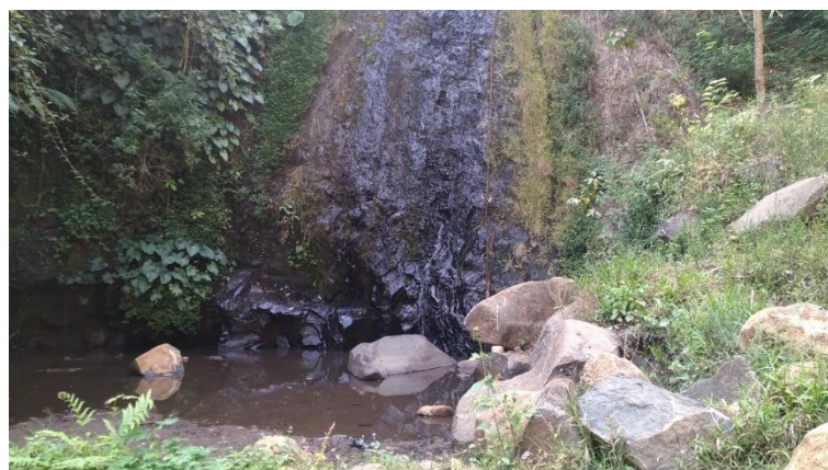
Gambar 4. Potensi Wisata Curug Kancil

Gambar di atas menjelaskan cara mencuci tangan yang baik dan benar kepada peserta. Selain itu juga dilaksanakan pemberian materi mengenai pakai masker, jaga jarak, dan tetap bersih. Kemudian setelah pemberian materi dilanjutkan dengan kegiatan menonton animasi edukasi mengenai pencegahan COVID-19.