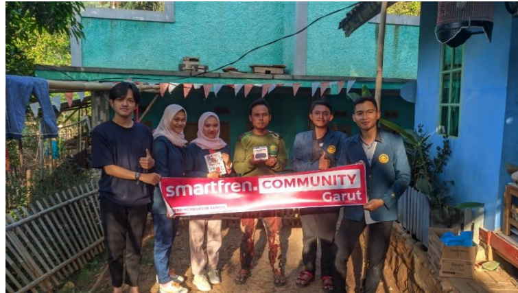
Gambar 7. Penyerahan Tanda Terima Kasih kepada Ketua RW 05.

Gambar di atas merupakan penyerahan tanda terima kasih berupa modem untuk kebutuhan akses internet yang di sponsori oleh Smartfren.