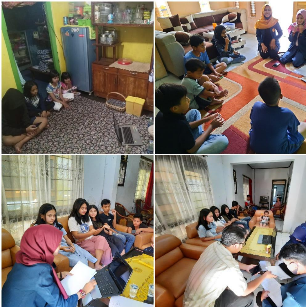
Gambar 5. Pemberian Materi

Terkecuali pada minggu pertama dimana penyuluhan dari Pemadam Kebakaran di laksanakan.