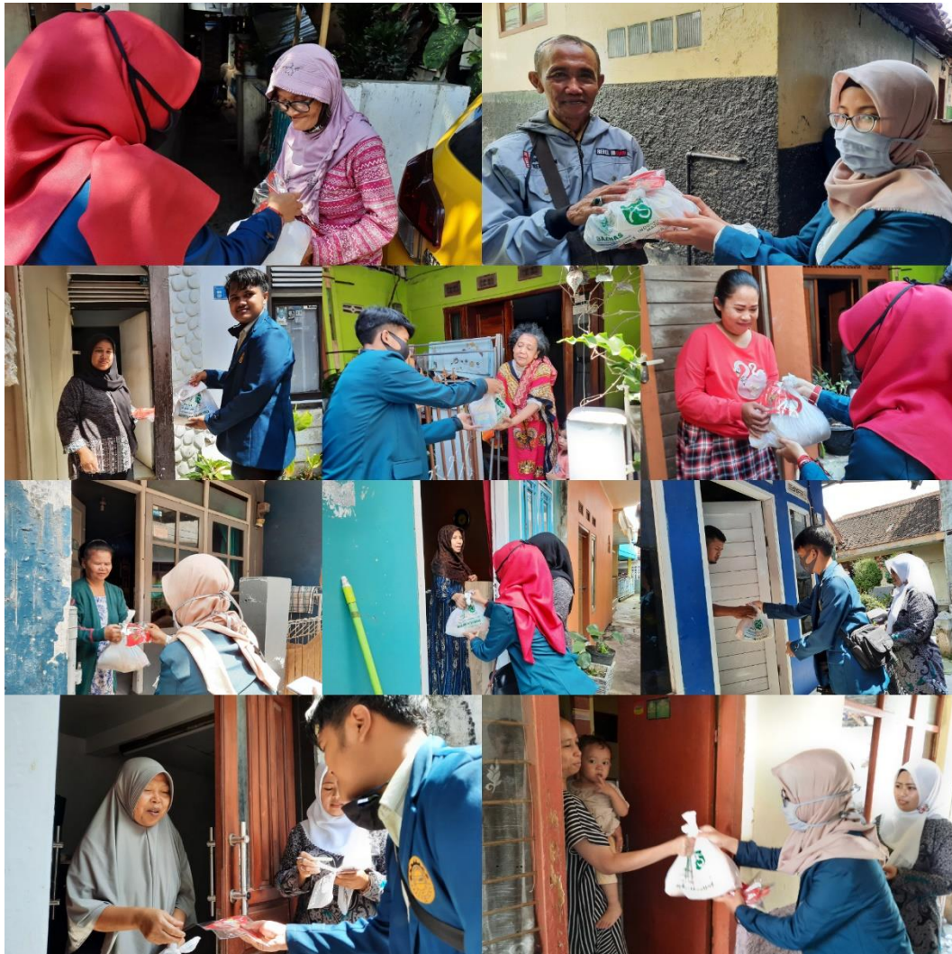
Gambar 4. Kemanusiaan Bersama BAZNAS

Dan pada hari kedua setiap minggunya setelah minggu pertama melakukan kemanusiaan dengan membagikan sembako dari Badan Amil Zakat Nasional (BAZNAS) kepada masyarakat Rw 03 secara berkala.