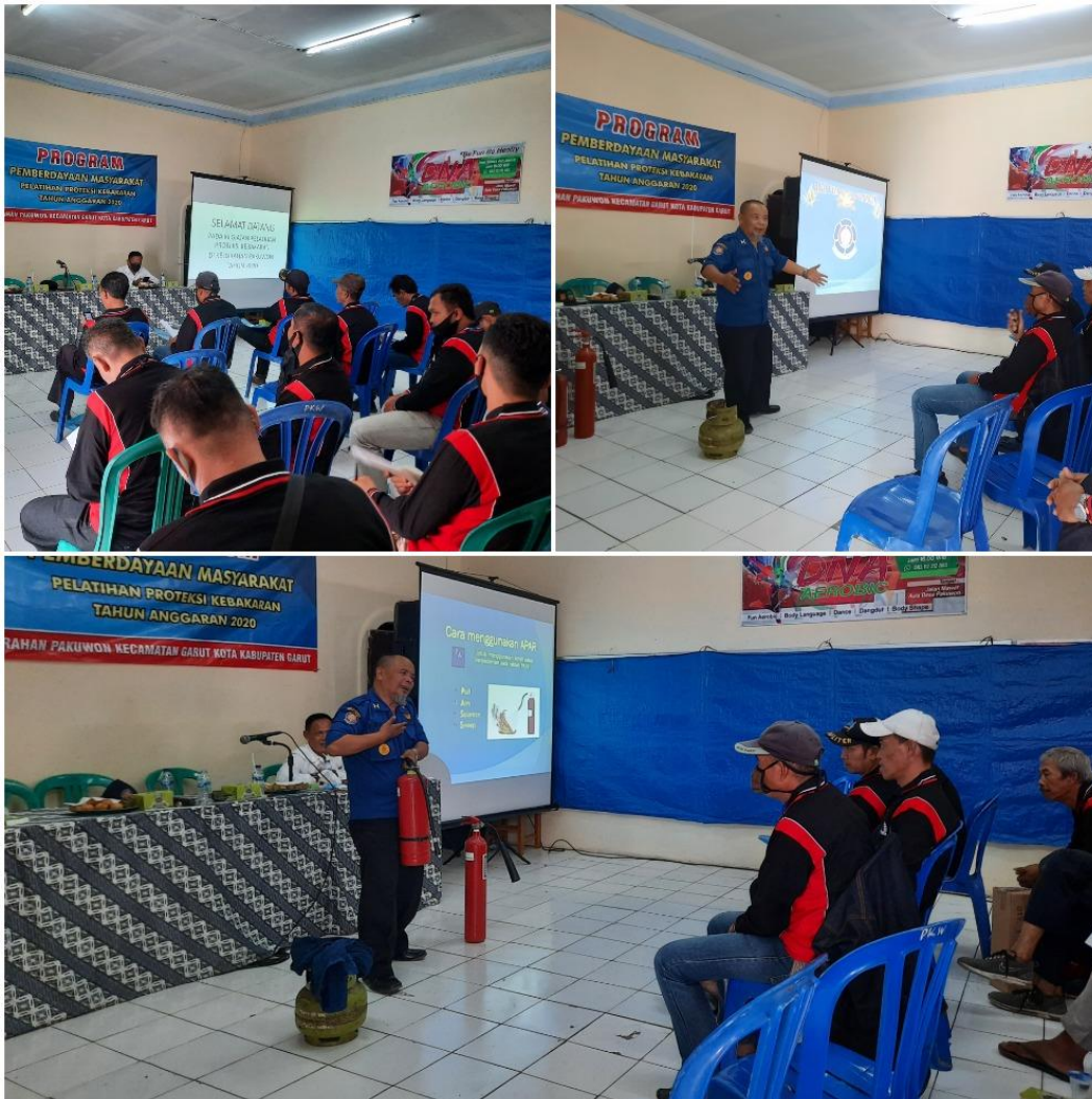
Gambar 6. Penyuluhan dari Damkar