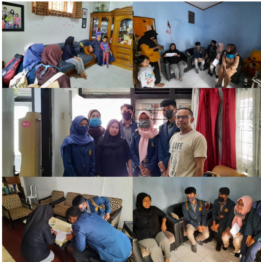
Gambar 3. Membantu Pihak Rt.02 Rw.03 Mengumpulkan Foto copy KK dan KTP untuk sensus Online 2020