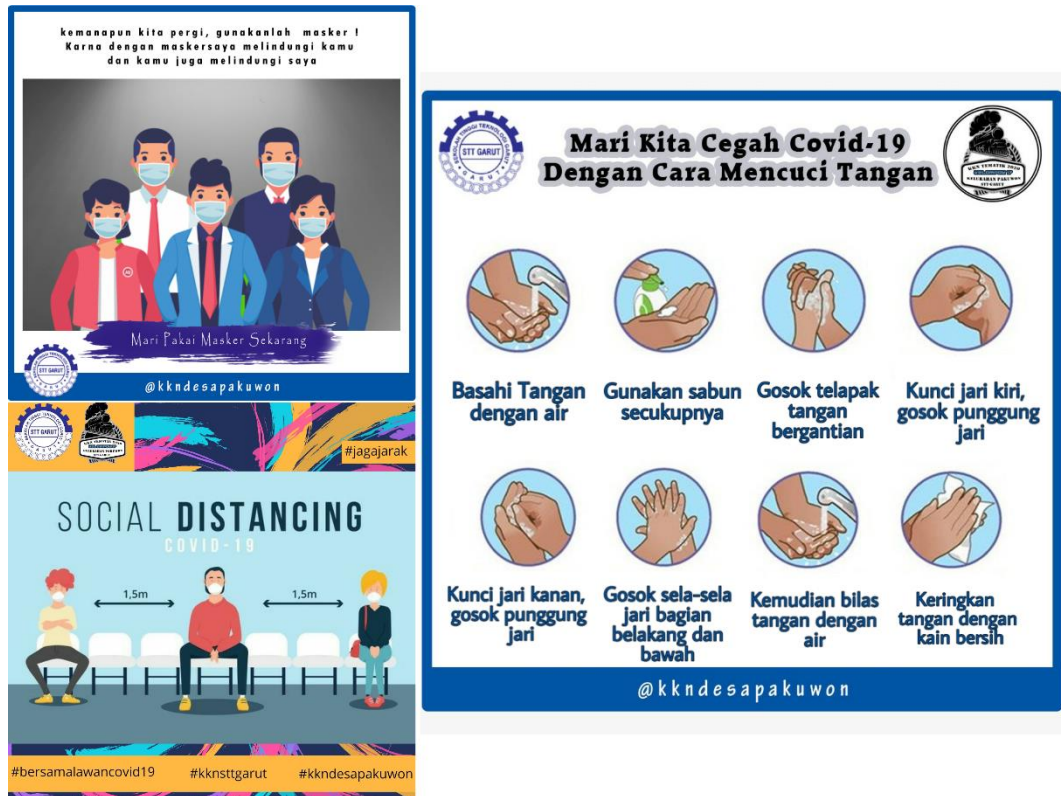
Gambar 7. Membuat dan Menyebarkan Konten