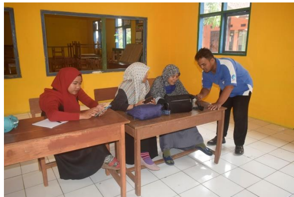
Gambar 2. Pendampingan Guru