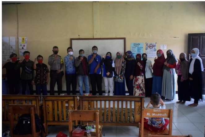
Gambar 1. Sosialisasi Program

Dalam pelaksanaan sosialisasi program, memberikan penjelasan mengenai program dan meminta saran dan masukan dari masyarakat untuk keberhasilan program. Selain itu mengajukan beberapa pertanyaan ( pre test ) mengenai masalah pembelajaran daring dan meminta beberapa pemuda untuk membantu program. Selain itu juga melakukan sosialisasi kepada salah satu internet service provider perorangan untuk dijadikan mitra.