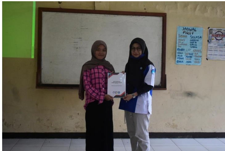
Gambar 4. Penyerahan Buku Panduan Versi Siswa

Selain program ini akan dilanjutkan oleh masyarakat itu sendiri dan mitra, program ini akan dilanjutkan oleh organisasi Komunitas TIK pada waktu yang akan datang dan akan dijadikan program kerja.