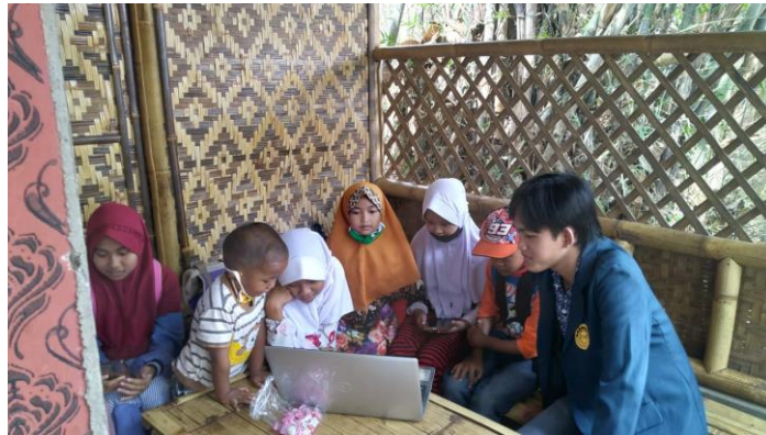
Gambar 3. Pendampingan Siswa

Selain melakukan pelatihan dan pendampingan kepada guru dan siswa, pendampingan dan pelatihan ditunjang oleh pemasangan internet gratis untuk warga dan buku panduan versi guru dan versi siswa.