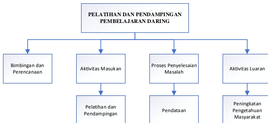
Gambar 1. Work breakdown structure Program Kerja

Metode dalam penulisan artikel ini menggunakan pendekatan integrasi relawan TIK (Cahyana, 2018) dengan tahapan, yaitu 1) bimbingan dan perencanaan dari pembimbing ; 2) aktivitas masukan penerapan ilmu pengetahuan dan teknologi; 3) Proses penyelesaian masalah dalam aktivitas pengajaran, penelitian; 4) aktivitas keluaran yang memberikan pengetahuan dan teknologi yang dapat mengubah kondisi masyarakat.